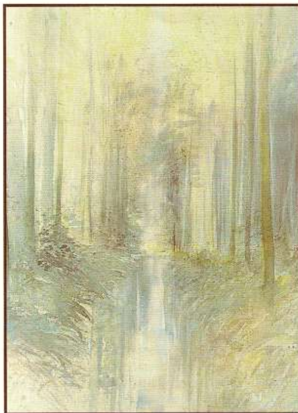
Herfstlicht langs de beek, 39x54 cm, aquarel op archespapier

Of hij nu een 'Herfstdreef' schildert, 'Boomgaard van de Broqueville', 'Heiderust' of 'Bloesemspel', telkens is het vooral de persoonlijke weergave van het licht die je aantrekt. Nu eens hangt het mysterieus over het 'Kongovaartje', dan weer ligt het kwistig verspreid over de bloeiende boomgaard, biedt het warmte en geborgenheid in de stille herfstdreef of valt het uit de wolken over de grijze watervlakte