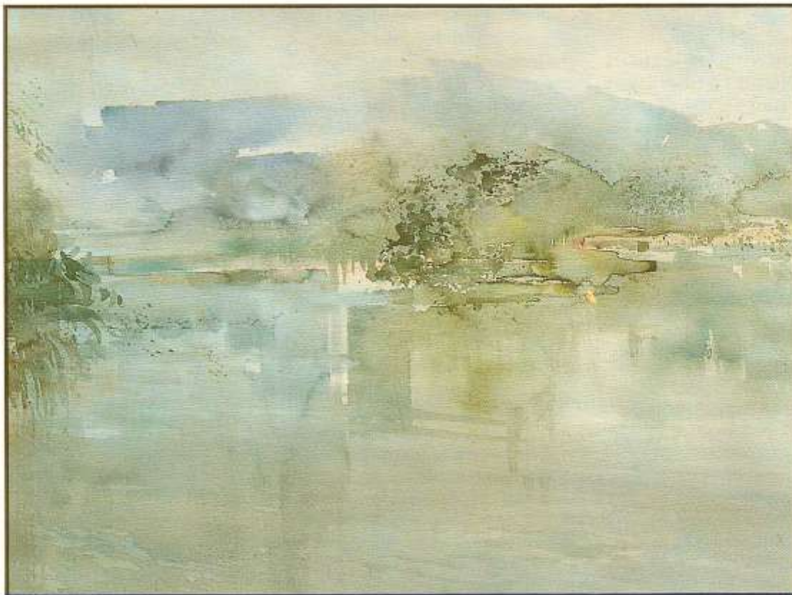
Zomer over het natuurreserveaat, 55x74 cm, aquarel op archespapier